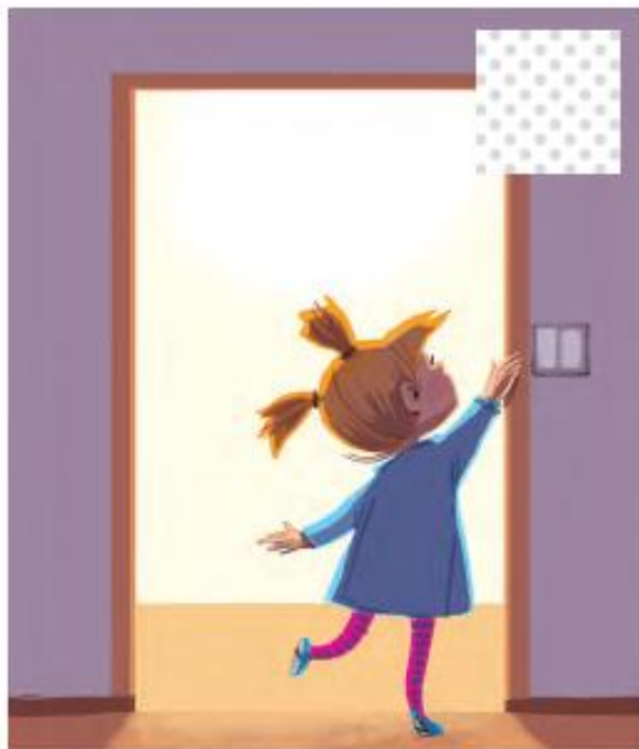
Gaszę światło, gdy wychodzę z pokoju.