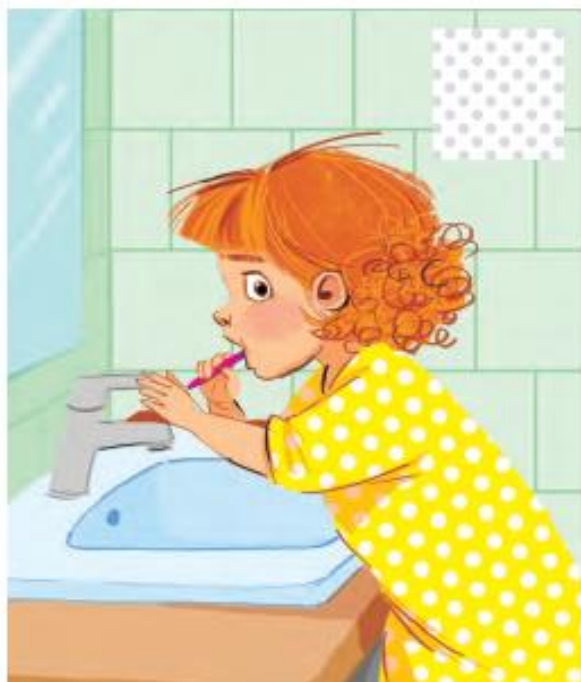
Zakręcam wodę, gdy szczotkuję zęby.